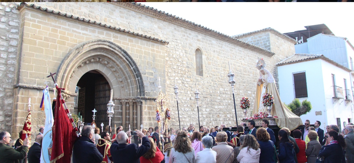
▲ Rosario de la Aurora Extraordinario en la Parroquia de El Salvador ▲