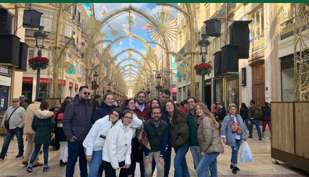
▲ Viaje a Málaga para la visita de la Iluminación navideña de la calle Larios