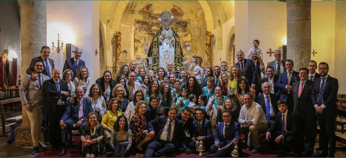
Apertura del Curso Cofrade ▲