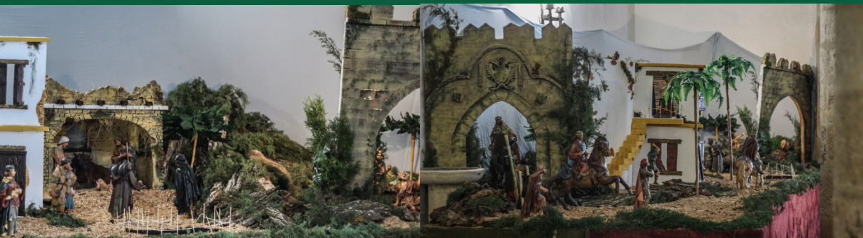
▲ Belén Navideño