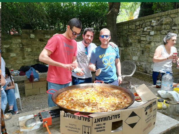
▲ Comida de Costaleros