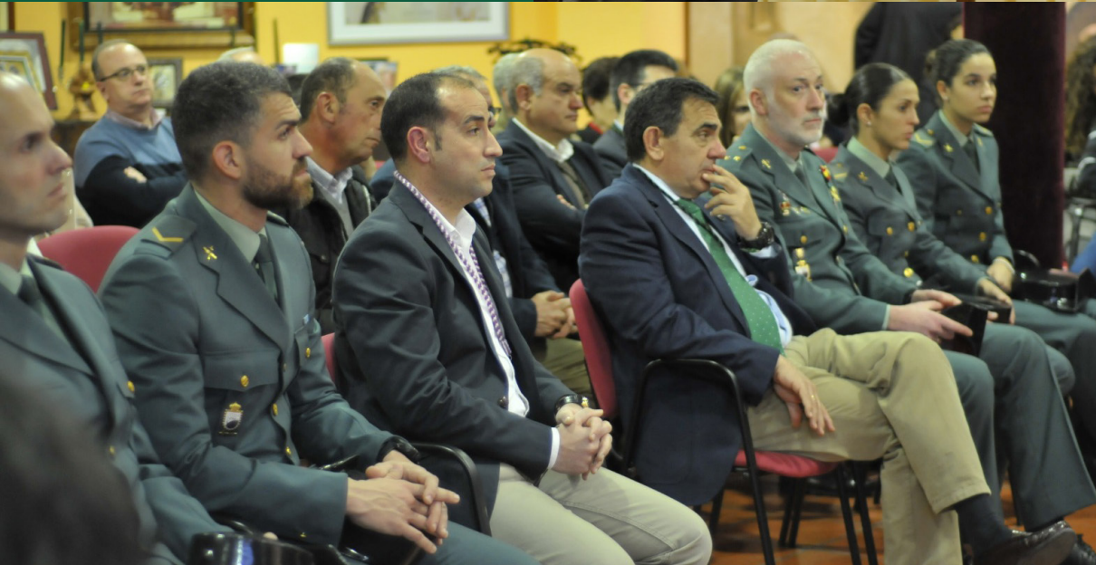
Presentación de los actos del 75 Aniversario de la llegada del Señor a Baeza ▲