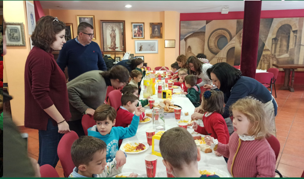
▲ XVI Encuentro de Jóvenes Cruceros