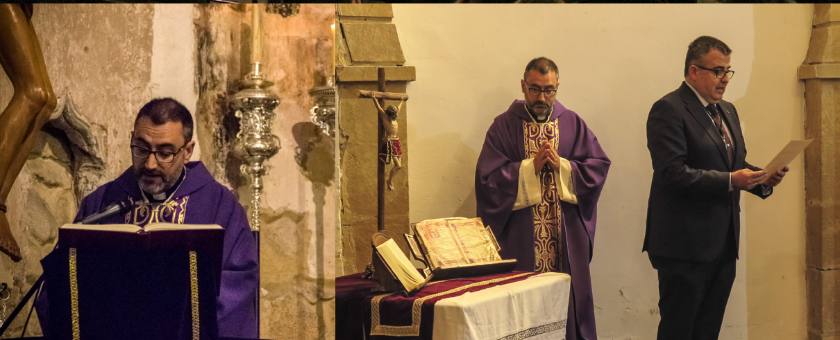
▲ Triduo Cuaresmal y Toma de Posesión de la nueva Junta de Oficiales