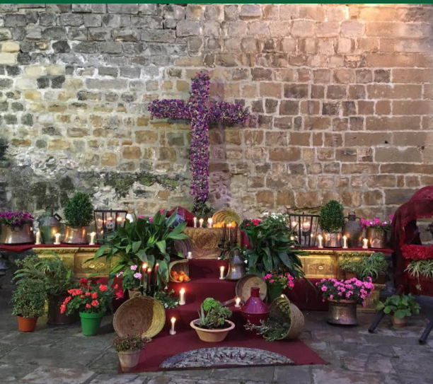
Cruces de Mayo ▲