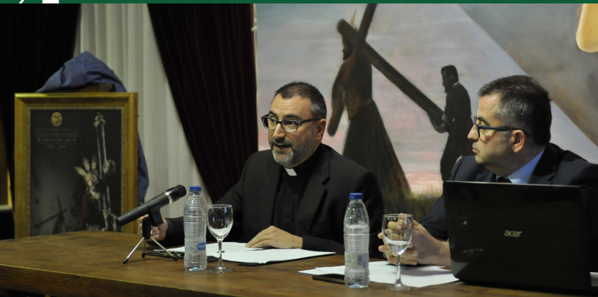
▲ Presentación de los actos del 75 Aniversario de la Llegada del Señor a Baeza