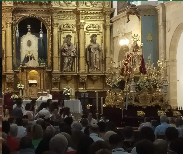
▲ Participación del Grupo Joven en la Novena y Serenata a nuestra Patrona ▲