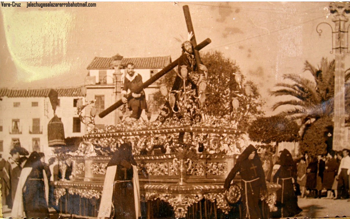
El Cristo de la Vera-Cruz en su recorrido por el Paseo. Foto de los años 60

Vera-Cruz | jalechugasalazararrobahotmail.com