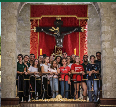
▲ Peregrinación al Santuario de la Yedra y participación del coro Infantil en la Santa Misa