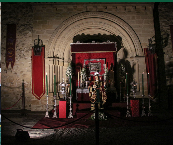
▲ Corpus Christi