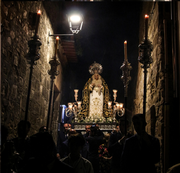
Apertura del Curso Cofrade ▲