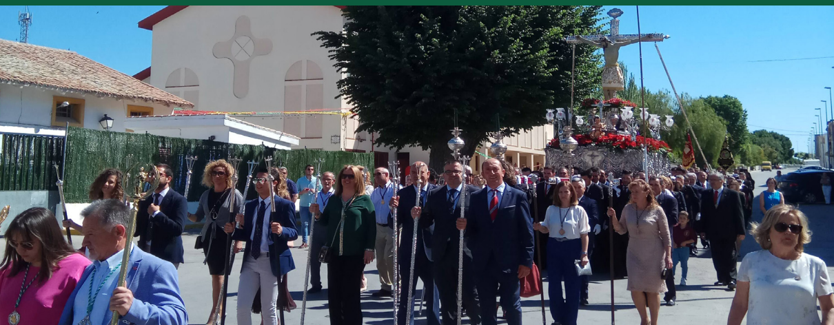
▲ Acompañamiento a la procesión extraordinaria por el VI centenario fundacional de la Vera+Cruz de Villacarrillo