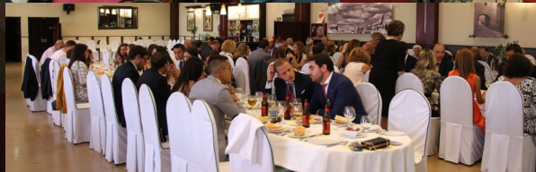
Fiesta de Estatutos, Calbido General de Hermanos, Medalla de Oro de la Cofradía y comida de hermandad ▲