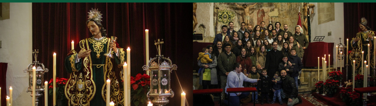
▲ Fiesta de San Juan Evangelista