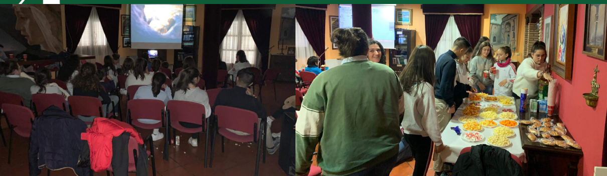
▲ Convivencia del Coro Infantil de la Cofradía ▲