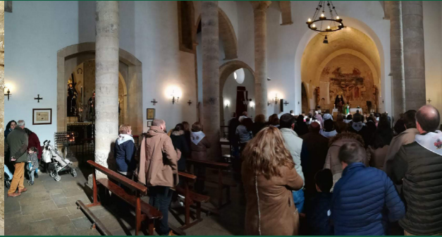
▲ Convivencia con los hermanos de la Vera+Cruz de Villacarrillo